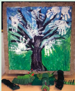
Iz igraonice Kozari Bok

U sklopu rada "igraonica" početkom siječnja je organizirana i izložba dječjih radova Živjeti i učiti dječja prava u Područnoj knjižnici Galežnica u Velikoj Gorici.